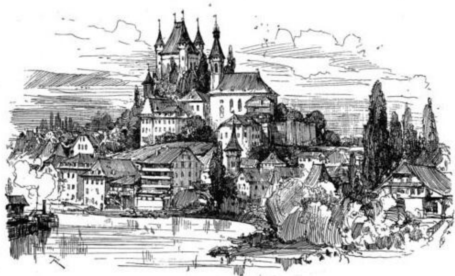
La colline de Thua.